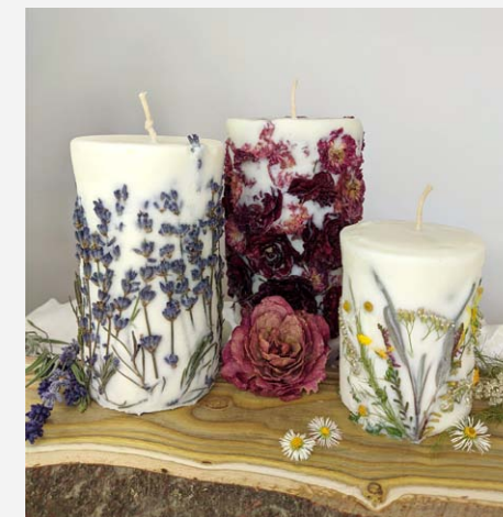
KGW Łopiennik Dolny Kolonia

Koła gospodyń wiejskich to bez wątpienia wyjątkowa organizacja – z długą, piękną historią. Organizacja, która dotrzymuje kroku współczesności i ma wielki potencjał na przyszłość.