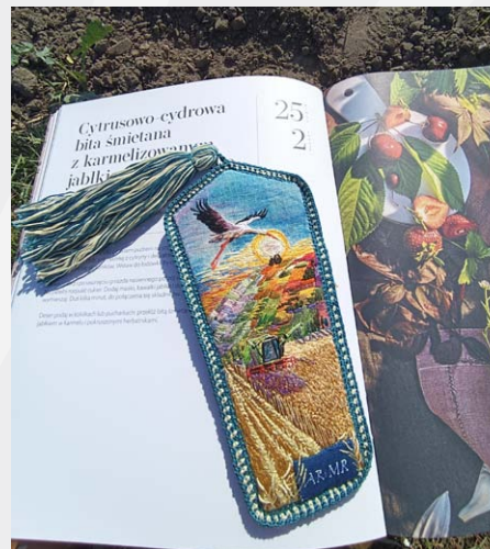
Koło Gospodyń Wiejskich „Marianki” w Marianowie

„Gospodynie działające w Kole Gospodyń Wiejskich w Rudzie Białaczowskiej są inicjatorkami wielu imprez sportowo-rekreacyjnych, mających na celu integrację lokalnej społeczności. Latem organizują dla mieszkańców Piknik Rodzinny, jesienią – ogniska i tradycyjne pieczenie ziemniaka, natomiast zimą – Mikołajki lub Choinkę dla dzieci. Poza działaniami na terenie Rudy Białaczowskiej Koło Gospodyń Wiejskich bierze udział w różnego rodzaju festynach, przeglądach kół gospodyń wiejskich, konkursach i specjalistycznych szkoleniach. Współpracuje również z instytucjami działającymi na terenie gminy Gowarczów, jak Centrum Kultury i Aktywności Lokalnej, z którym wspólnie organizuje dla dzieci akcje feryjne czy letnie, podczas których oprócz gier i zabaw dzieci mają możliwość spróbowania swoich sił w kuchni, piekąc ciasteczka czy rogaliki. Ponadto Koło organizuje akcje charytatywne, np. zbiórkę przyborów szkolnych dla domu dziecka w Radomiu. Gospodynie działające w Kole rozwijają się również artystycznie, wykonując różne rękodzieła, np. ozdoby ludowe, bożonarodzeniowe czy wielkanocne. Ponadto Panie chętnie uczestniczą w spotkaniach dedykowanych specjalnie dla nich, np. dotyczących kobiecej urody. Integracja osób działających w Kole jest bardzo ważna, dlatego też organizowane są wspólne wyjazdy do kina, czy teatru” – to z kolei fragment relacji KGW z Rudy Białaczowskiej, które zostało założone w czerwcu 2019 r.